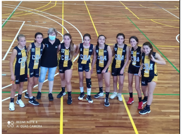
Terceres nivell B2