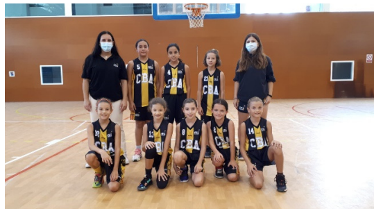
Han quedat sisenes en la categoria C1