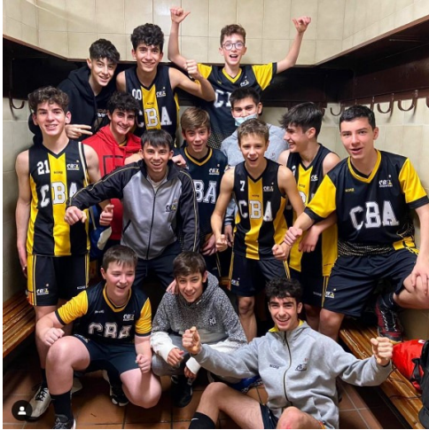
Segons de nivell B-1