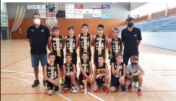
El A.R. MOTORS MATARO-CB ARGENTONA , ha quedat quart en la categoria B1