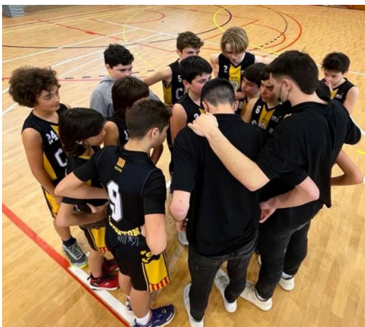
Primers de nivell B2