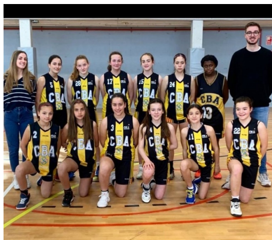
El Farmàcia Sindreu – CB Argentona han quedat vuitenes de nivell B2.