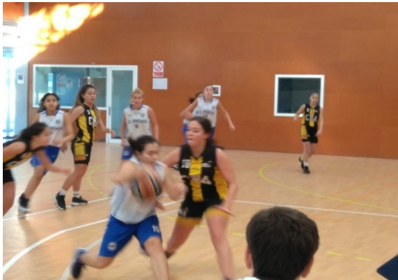
Han jugat a nivell C2