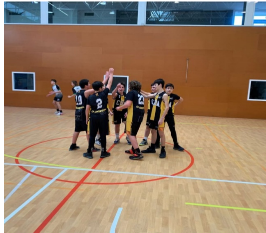
Segons de nivell C1